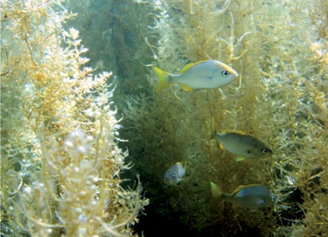
Rayadillos aleta amarilla, Haemulon flaviguttatum , habitan entre los talos de sargazo.