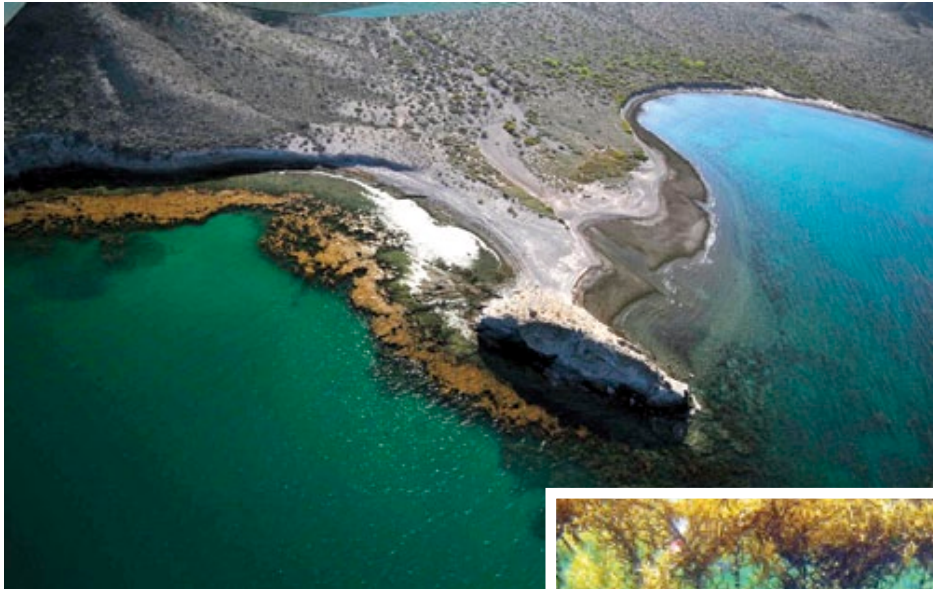
Panorámica aérea de los bosques de Sargassum en Isla Tiburón, Golfo de California, donde habita una gran riqueza de especies marinas.

ALVIN NOÉ SUÁREZ CASTILLO, 1* RAFAEL RIOS MENA RODRÍGUEZ, 1 MARIO ROJO AMAYA, 2 JORGE TORRE COSIO, 2 RODOLFO RIOJA NIETO, 3 AMY HUDSON WEAVER, 3 TAD PFISTER, 4 GUSTAVO HERNÁNDEZ CARMONA, 5 GUSTAVO HINOJOSA ARANGO, 6 OCTAVIO ABURTO OROPEZA 6 Y ANA LUISA FIGUEROA CÁRDENAS 7